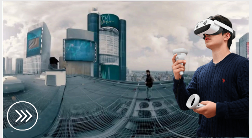
FILM STARTEN ZUR GESCHICHTE FRANKFURTS

Dank Virtual Reality werden komplexe Prozesse, entfernte Welten und abstrakte Phänomene greifbar. Machen Sie naturwissenschaftliche Phänomene hautnah erlebbar oder bieten Sie eine Reise in vergangene Zeiten an. Entdecken Sie die Möglichkeiten des Einsatzes von VR-Brillen im Unterricht , z.B. Erdkunde, Geschichte, PoWi, Berufsorientierung.