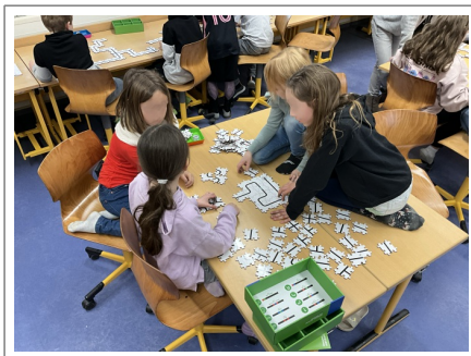
Spaß beim Coding mit Ozobot, Idstein, Klasse 3

Wir kommen zu Ihnen an die Schule und unterstützen Sie bei Ihrem Wunschprojekt - folgende Termine sind aktuell verfügbar: