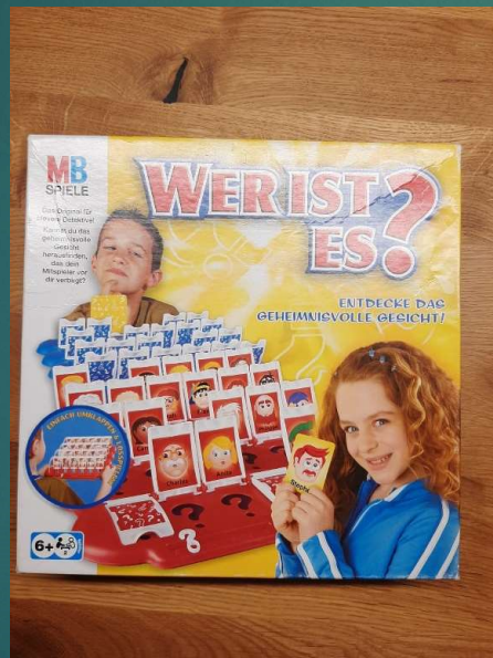
In ganzen Sätzen sprechen, Menschen beschreiben: blaue Augen, braune Haare...