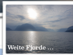
Weite Fjorde ...