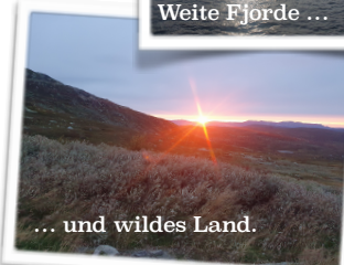
... und wildes Land.