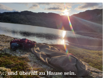
... und überall zu Hause sein.