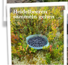
Heidelbeeren sammeln gehen ...

In Norwegen gilt das Jedermannsrecht, das den freien Nutzen der Natur erlaubt. Es ist also unter anderem überall erlaubt wild zu Campen und ein Lagerfeuer zu zünden. Zusätzlich ist die Infrastruktur (öffentliche Toiletten, etc.) sehr gut angelegt und mit einem Auto ist man frei und hat überall eine Bleibe für die Nacht.