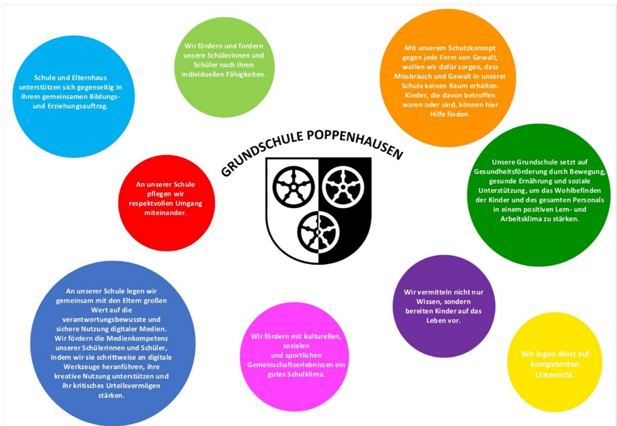
Leitbild der Grundschule Poppenhausen (Stand Februar 2025)

die „Kompetenzen in der digitalen Welt “ umfassen: 1. Suchen, Verarbeiten und Aufbewahren 2. Kommunizieren und Kooperieren 3. Produzieren und Präsentieren 4. Schützen und sicher Agieren 5. Problemlösen und Handeln 6. Analysieren und Reflektieren (Vgl. Strategie der Kultusministerkonferenz „Bildung in der digitalen Welt “ Beschluss der Kultusministerkonferenz vom 08.12.2016 in der Fassung vom 07.12.2017, S. 10-20) Diese sechs Kompetenzbereich der Medienbildung dienen uns selbst als Orientierungsrahmen bei der Realisierung des Medienkonzeptes sowohl im Fachunterricht als auch außerhalb oder fächerübergreifend. Um diese Umzusetzen wollen wir die technischen Voraussetzungen schaffen, die Lehrkräfte fortlaufend im Umgang mit modernen Medien schulen, streben die Zusammenarbeit mit der Elternschaft an und werden unser Medienkonzept stetig weiterentwickeln.