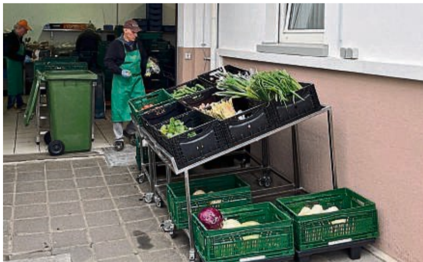
Die Lebensmittel werden für die Ausgabe bereitgestellt.