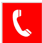
Brandmelder nach BGV A8