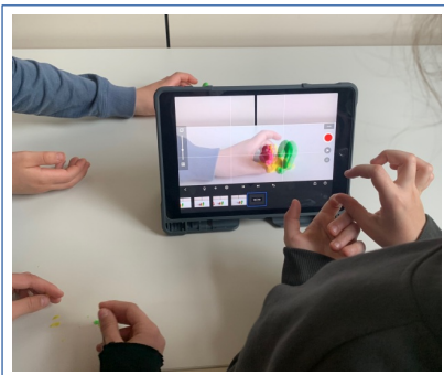
Viel Spaß hatten die 2. Klassen in Walluf beim Stop-Motion-Film mit dem DFF

Vielen Dank für Ihre Anfragen- unsere Projekt-Termine bis zum Schuljahresende sind fast alle gebucht. 😊